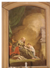
Tableau de Saint Roch

Sainte Anne, assise, montre en souriant un livre posé sur ses genoux à la petite Marie agenouillée devant elle.